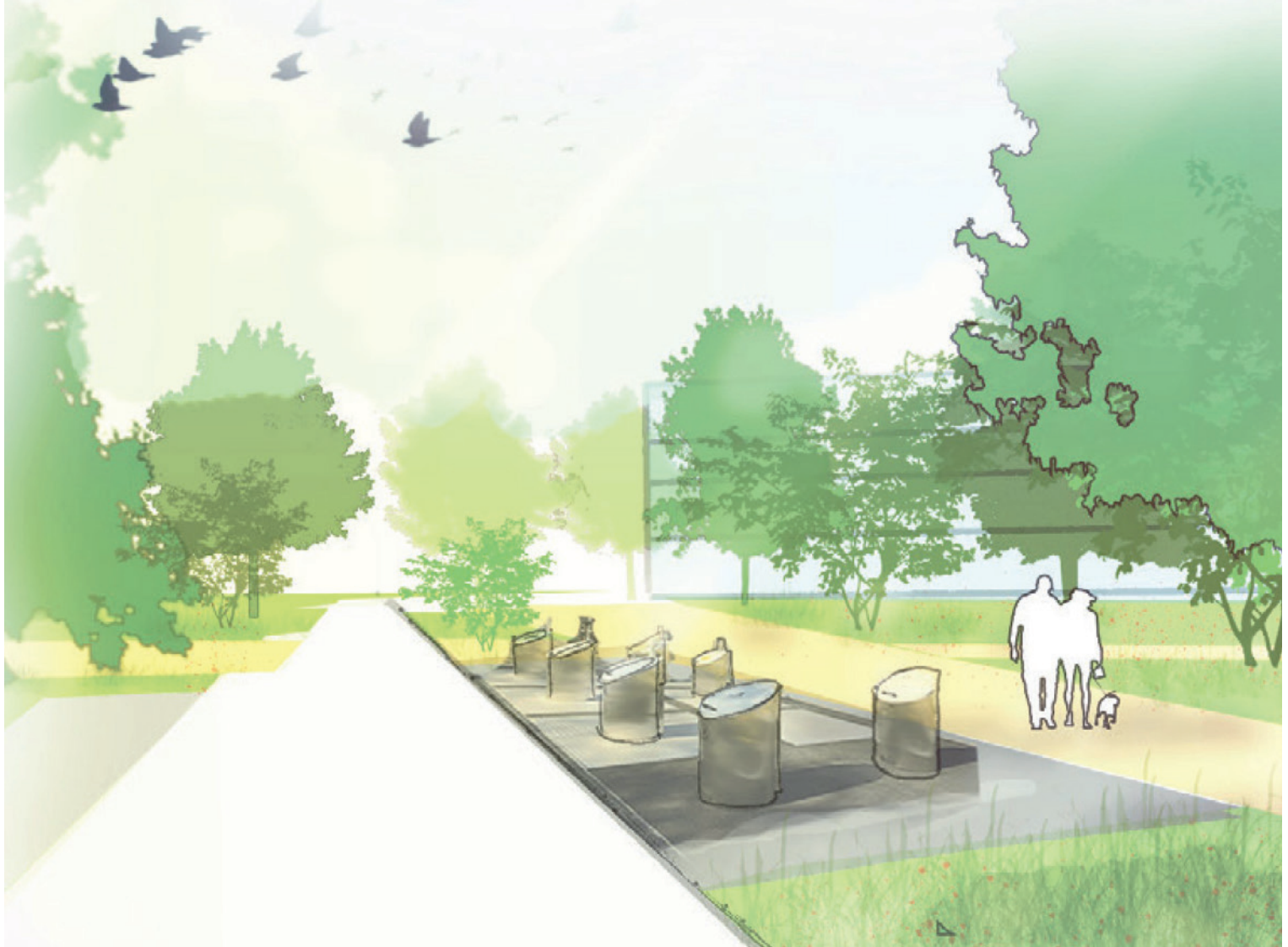
Vision future du chemin d'Archamps – présentation publique 12 octobre 2023