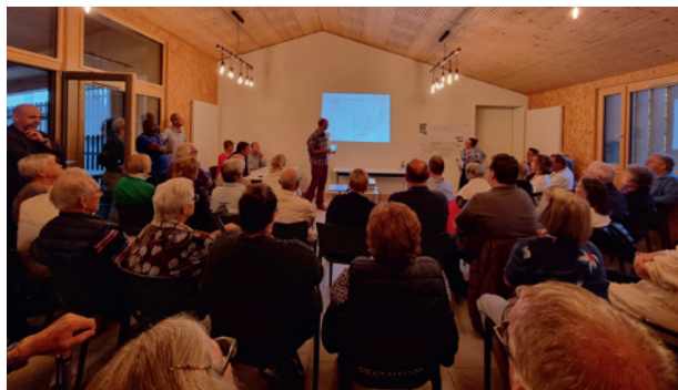
Présentation publique à La Bossenaz

La volonté de réaménager ce chemin avec de la végétation est bien présente et vient en amont du projet de loi climat cantonal du Conseil d'Etat, qui demandera de planter de nouveaux arbres afin d'atteindre un taux de canopée de 24%. Bien que notre commune soit grandement rurale, la